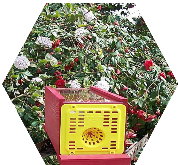
Piège chez un particulier