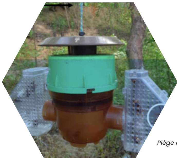
Piège coréen à ailes