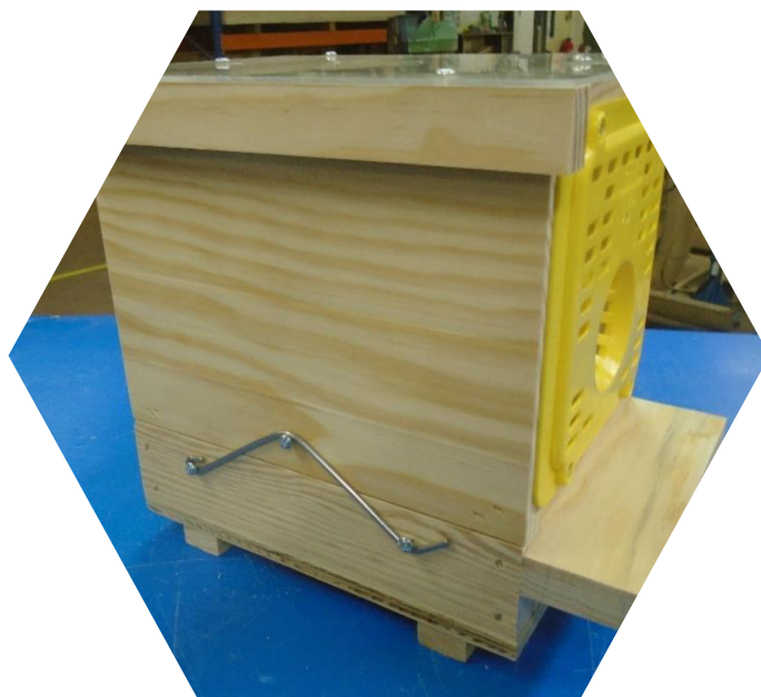
Piège nasse à grilles Néoppi jaunes

Renouveler l'appât au plus tous les 8-10 jours, en laissant quelques frelons vivants à l'intérieur du piège, les phéromones attirent les frelons et repousseraient les autres insectes.