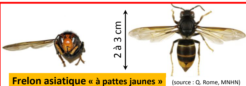
Frelon asiatique « à pattes jaunes »