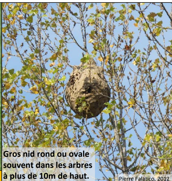
Gros nid rond ou ovale souvent dans les arbres à plus de 10m de haut.