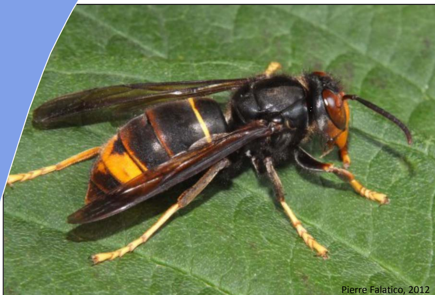
Pierre Falatico, 2012