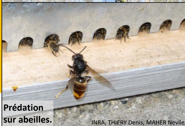
Prédation sur abeilles.